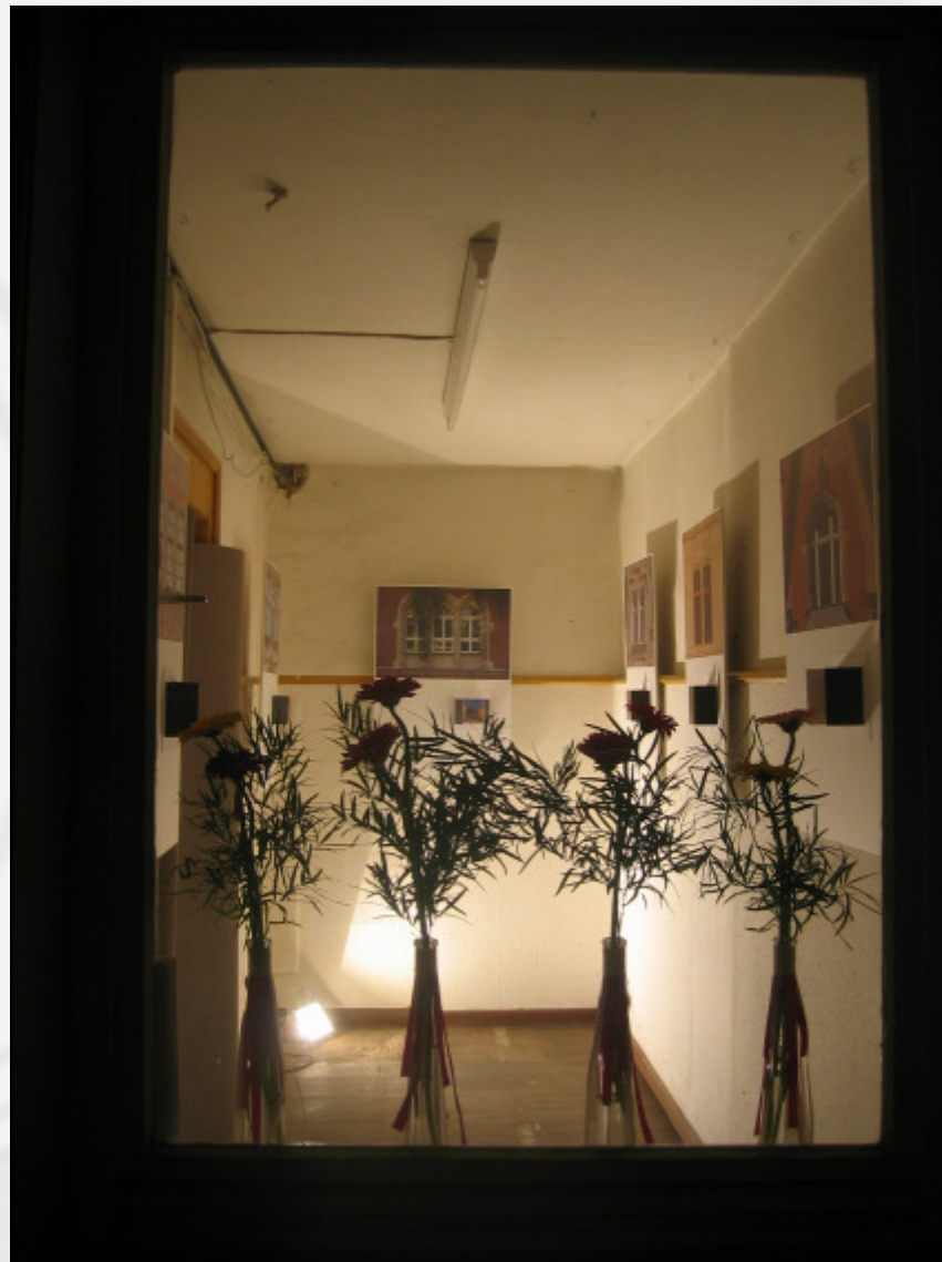
Bilder der Ausstellung